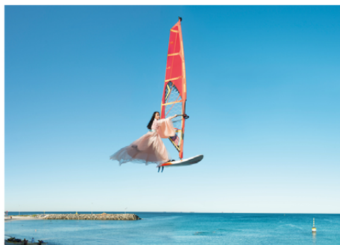
© Li Wei, Sail, 2016, Cottesloe, Australie