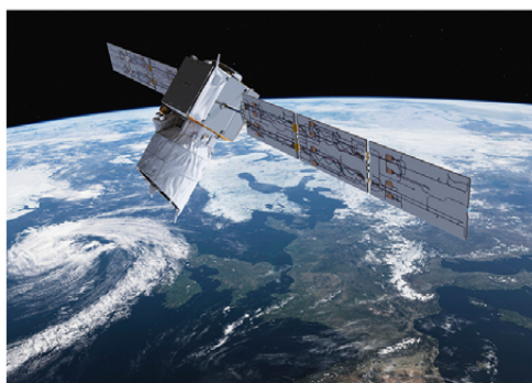
©ESA/ATG medialab - Agence Spatiale Européenne. Aéolus, mesure des vents à l'échelle planétaire, 2018

Aujourd'hui, nos imaginaires urbains industriels et post-industriels ont tourné le dos au vent. Mais les impératifs du changement climatique nous enjoignent à revenir vers lui. Alors qu'au large de nos côtes, un parc éolien en mer est en cours de développement, il devient nécessaire de se reconnecter à ces forces naturelles et infinies, de retrouver cette culture du vent et d'en saisir tous les enjeux.